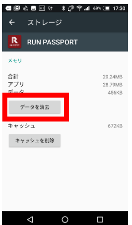
⑩「データを消去」をタップします