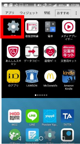
①設定画面を開きます