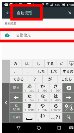
③「自動復元」と入力し、検索結果に表示された「自動復元」をタップします