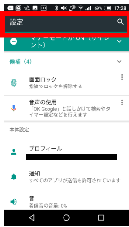
②画面上部の虫眼鏡マークをタップします