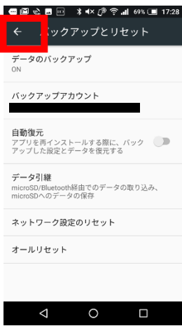
⑤オフにした後、画面上部の「←」をタップして設定のトップ画面に戻ります。