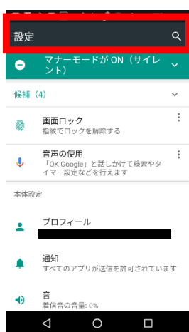
⑥画面上部の虫眼鏡マークをタップします