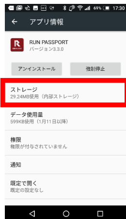
⑨「ストレージ」をタップします