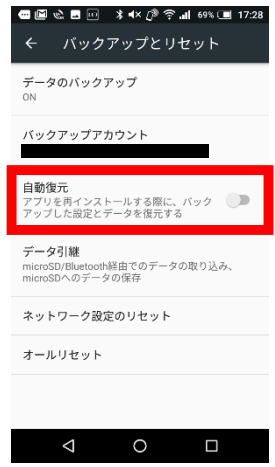
④「自動復元」をオフにします。